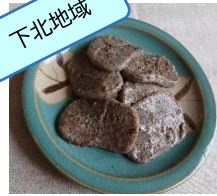
米作には適さず、じゃが芋を主にした料理が多い