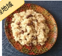
米作に恵まれ、米を使った料理やおやつが豊富