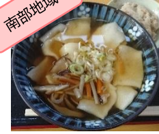
小麦・そば等雑穀を用いた料理が多い